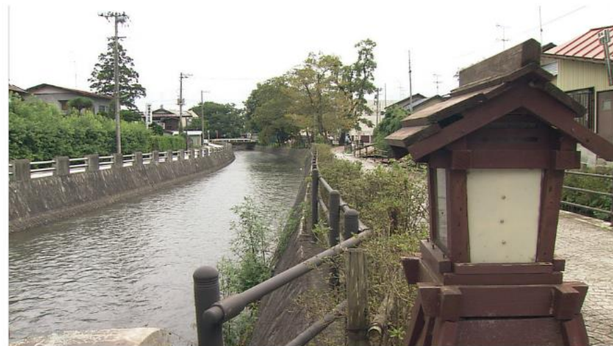
城下町を流れる内川