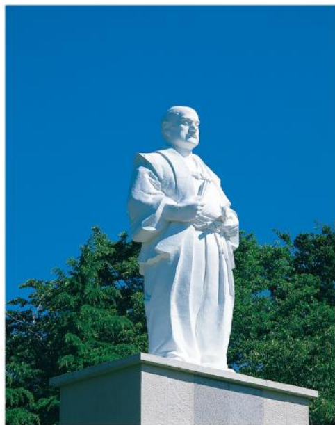
平和像(岩出山城跡)