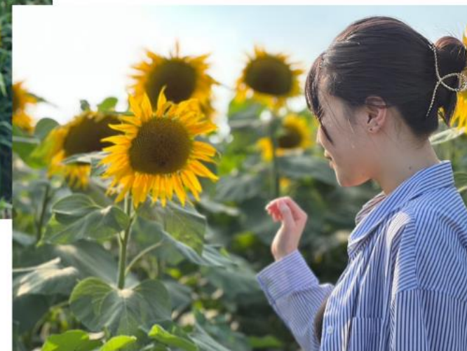
吹上高原キャンプ場